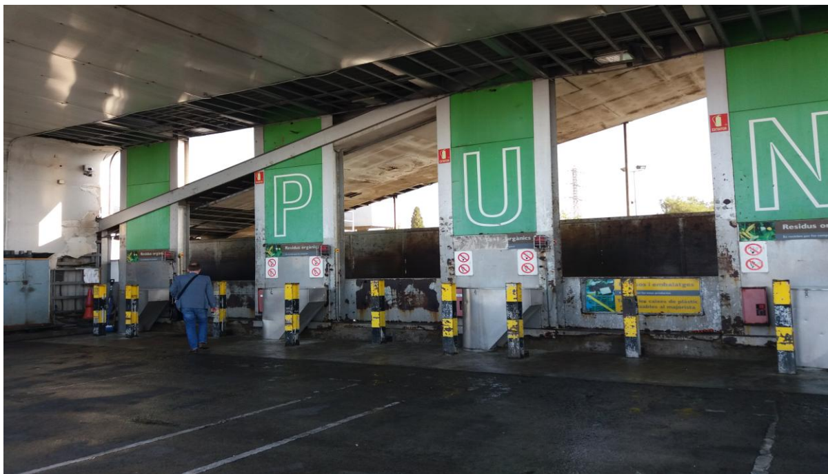
Ο χώρος διαλογής και αξιοποίησης των απορριμάτων της Mercabarna

Άλλωστε έγινε ξεχωριστή επίσκεψη και ξενάγηση στον χώρο συγκέντρωσης και διαλογής των οργανικών της Mercabarna, μία πρωτοποριακή δράση που ξεκίνησε την λειτουργία της το 2002 έφτασε στο συγκεκριμένο στάδιο ωριμότητας μετά από 3 χρόνια μελέτης και δοκιμών.